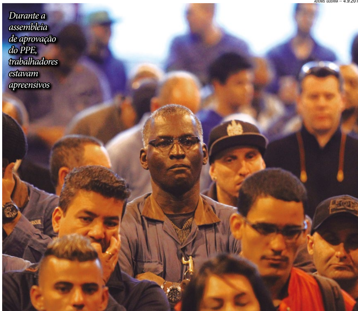
Durante a assembleia de aprovação do PPE, trabalhadores estavam apreensivos

“Por isso, defendemos o Programa, que preserva os empregos em períodos de baixa de produção. Valeu o esforço de todos na Schuler,